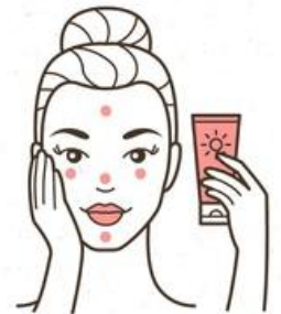
6. SUN PROTECTION