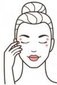
4. EYE CREAM