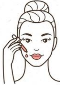
3. ANTIOXIDANT SERUM